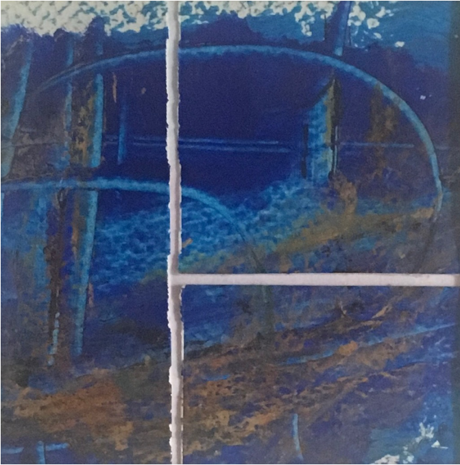
De ma fenêtre